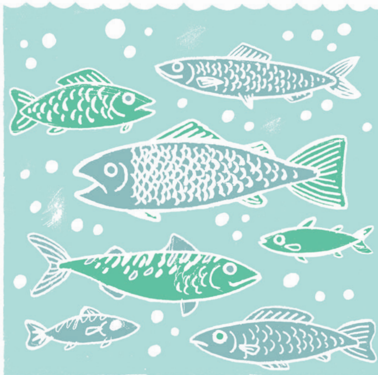
Linoleumssnit af Jens-Andreas D. Elkjær.