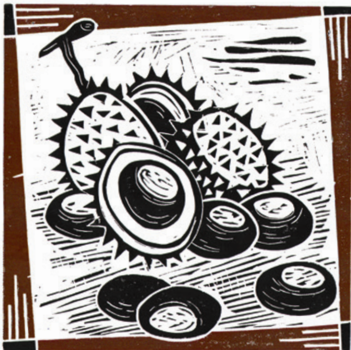
Linoleumssnit af Jens-Andreas D. Elkjær.